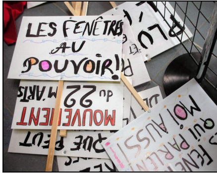
Villeneuve d'Ascq, 2008

Ce document n'est en aucun cas une règle, de plus il ne peut pas être exhaustif.